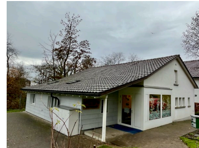
Kindergarten Grünenhof Evelyne Hauser